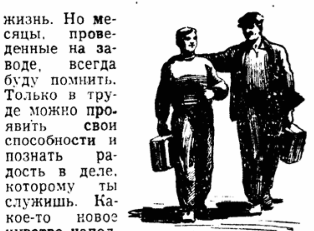
Рис. А. СТАРИНА